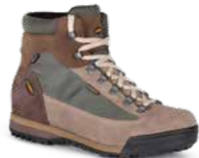
COD. 885.20/095 MARRONE SCURO - MARRÓN OSCURO