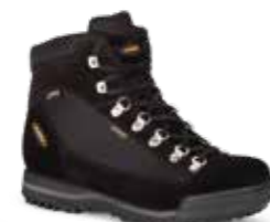
COD. 365.10/448 NERO-NERO NEGRO-NEGRO