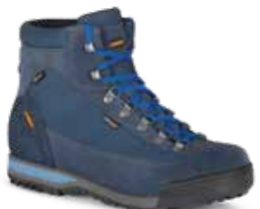
COD. 885.10/405 DENIM-BLU - DENIM-AZUL