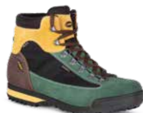
COD. 885.20/110 NERO-VERDE - NEGRO-VERDE