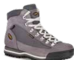
COD. 365.10/415 GRIGIO-STEAM GRIS-STEAM