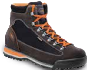
COD. 885.10/108 NERO-ARANCIO - NEGRO-NARANJA