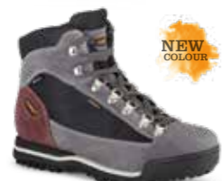
COD. 365.10/387 ANTRACITE-VIOLA FUMO ANTRACITA-HUMO MORADO