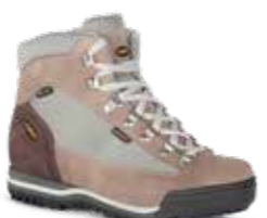
COD. 365.10/683 GRIGIO CHIARO-BEIGE GRIS CLARO-BEIGE