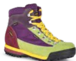
COD. 365.20/001 MULTICOLOR