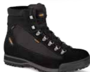
COD. 885.10/448 NERO-NERO - NEGRO-NEGRO