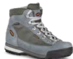
COD. 365.20/447 CONIFERA-VAPORE - CONIFERA-STEAM