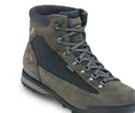
COD. 885.4/058 NERO-GRIGIO - NEGRO-GRÍS